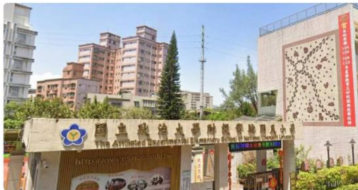
政治大學附設實驗小學1名鄭姓教師被控性騷。

[周刊王CTWANT] 政治大學附設實驗小學1名鄭姓教師被控性騷，已畢業的女校友踢爆，鄭師曾把她強拉到大腿上坐，還從身後突襲熊抱，甚至說「妳應該要拒絕我」，且受害者高達20人。時代力量立委王婉諭今(8日)陪同受害者舉行記者會，受害者A控訴，自從她發文踢爆狼師，陸續收到多名受害人反映，甚至有人被鄭師用手伸進內褲侵犯。