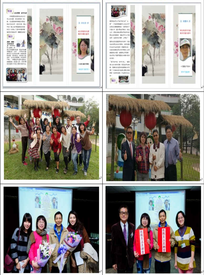
附圖 5-2：1月16日辦理2月1日退休教師歡送會集錦(★返回本文)