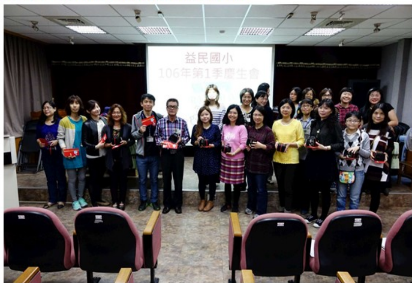
附圖 5-4：106 年度慶生會成果照(★返回本文)