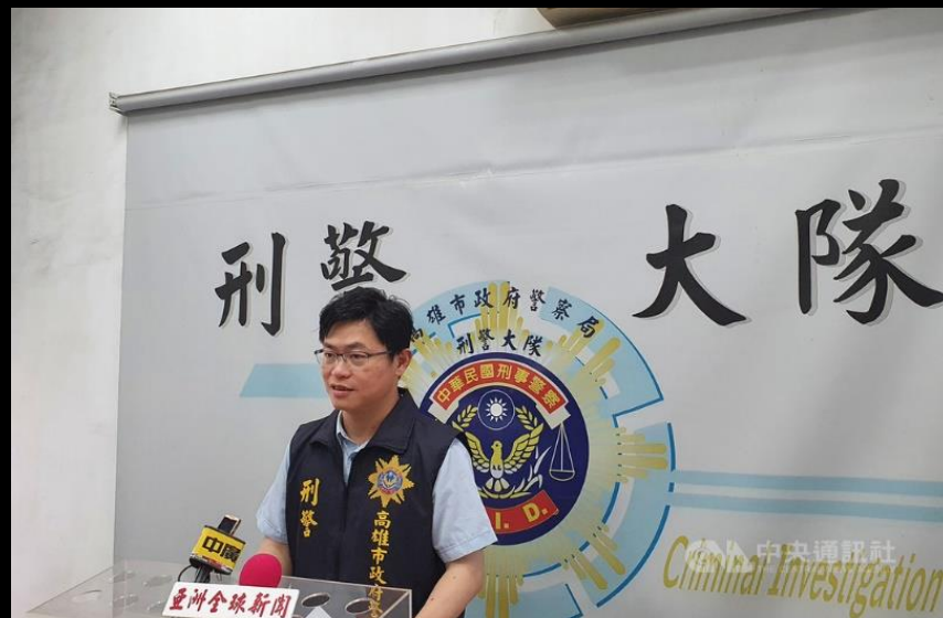
高雄市刑警大隊破獲 散布兒少性剝削影像網站