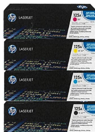
印表機耗材 原廠原裝